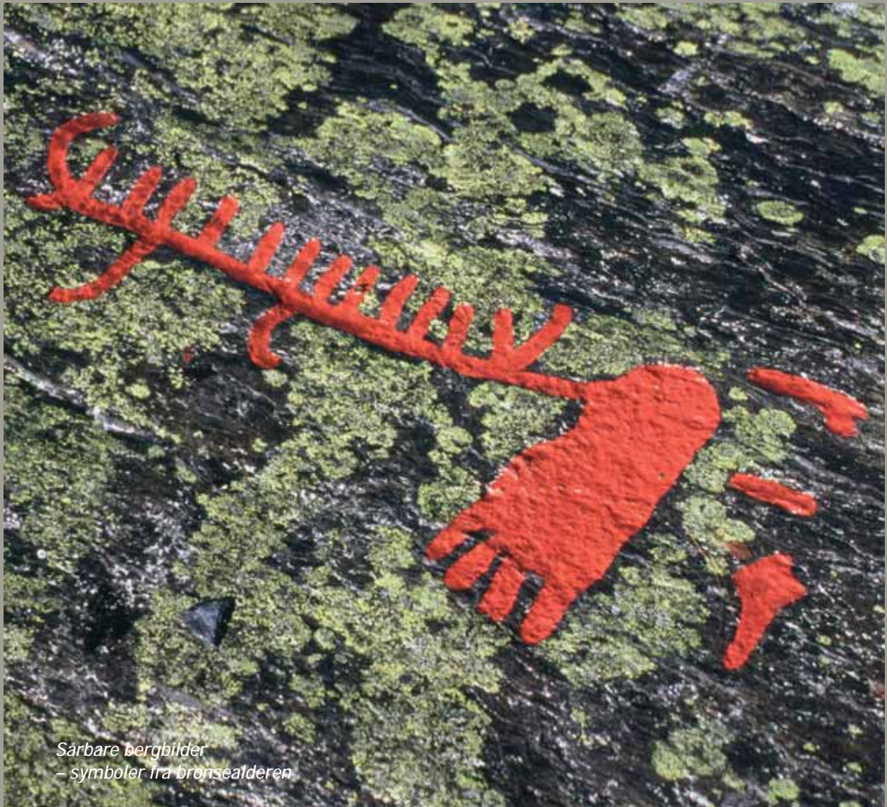
Sårbare bergbilder – symboler fra bronsealderen