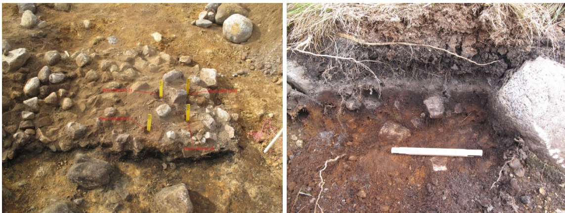
Figur 1: Foto til venstre viser hvor prøvene ble tatt i struktur 2AK1562 mens foto til høyre viser profil 1 i østre profilvegg hvor en av kontrollprøvene ble tatt (natvit nr 2014/12-23). Prøven ble tatt i det mørkt brune anrikningslaget, mellom det grå utvaskingslaget og undergrunnen.

Profiler og områder for prøveuttak ble først lett rensket for de ytterste jordlagene. To til fire prøver ble tatt ut fra hver utvalgte struktur (Figur 1 og 2). Cirka 100 ml jord ble tatt ut med graveskje. Skjeen ble vasket med avionisert vann mellom hver prøve. Prøvene ble også beskrevet ut fra Munsell's fargekart. Prøvene ble oppbevart i merkede prøvebokser/poser, og lufttørket i kjølerom.